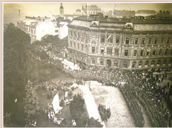
Snímek ze slavnostního odhalení sochy legionáře v r. 1923.