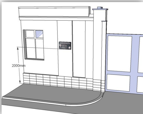
Obr. Projekt na umístění pamětní desky na venkovní stěnu závodu v Laurinově ulici u zaslepené 3. brány automobilky

Zachráněná deska byla předána pozůstalým po zavražděném Bohumilu Doušovi. Na své znovuoživení musela počkat celých patnáct let.