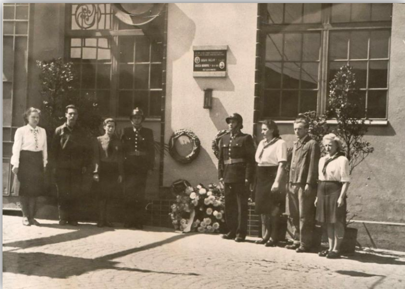
Obr. Fotografie z odhalení pamětní desky v roce 1946

Na svém místě setrvala až do 90. let, kdy byla při přestavbě budovy, na níž se nacházela, sejmuta a ztracena. Deska byla šťastnou náhodou nalezena zaměstnanci v odpadní suťi skladu se stavebním materiálem.