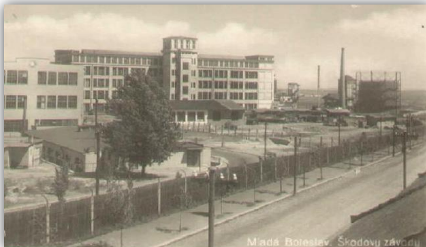
Obr. Pohled na předválečnou automobilku Škoda