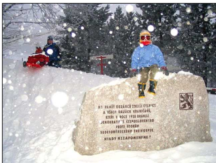
Fotografie hraničního přechodu Dolní Světlá – Waltersdorf ze dne 28. prosince 2005, 15 hod. a 40 min. Vidíme, že pomník a jeho blízké okolí, námi spravované, dokáží děti využít k příjemné zábavě. Hlavně že mají boby ten správný směr, směr do České republiky. ☺

Po více jak půl druhé, příjemně strávené, hodině jsme Rejchrtovým ještě jednou popřáli krásné svátky, mnoho zdraví a s nadějí na brzké shledání ( záminku uvádím výše ☺ ) vyrazili na zpáteční cestu. Brady