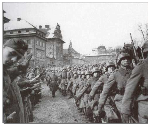
Okupační Německá armáda 15. března na Pražském hradě.

U snídaň jsme se dozvěděli, že německá armáda okupovala naše území. Nikomu nebylo do řeči. Tato zpráva nás tak překvapila, že jsme nebyli schopni promluvit. Čekali jsme, co bude v příštích hodinách. Dlouho jsme nečekali. Přišel rozkaz, odklízet sněh ve městě. Tehdy ho hodně napadlo. Považovali jsme za nedůstojné vojáka, odklízet sněh okupační armádě. I když velitel kasáren prohlásil, že půjde s námi, všichni do jednoho jsme kategoricky odmítli a poukázali na to, že v Benešově je pracovní tábor. Nešli jsme. Následoval další rozkaz: Nástup na chodbě všech vojáků se zbraní. Nastoupili jsme všichni s puškou, kterou jsme drželi před sebou a čekali. Přišel velitel kasáren a postavil se před nás. Jeho tvář měla tvrdé rysy, které naznačovaly bolest a smutek. Pronesl k nám kratší řeč, kterou zakončil slovy: „..... vojáci, nejsmutnější okamžik v životě vojáka je, když musí vydat svou zbraň a proto na znamení smutku, skloňte každý hlavu nad svou zbraň“. Po chvíli ticha jsme odevzdali zbraně a tiše se rozešli. Všechnu výzbroj, polní výstroj i vybavení kasáren, které na tehdejší dobu bylo značné a mělo velikou cenu, zajistili zástupci německé armády. - Nám postupně dali propouštěcí papíry a ve vojenských uniformách s poučením poslali domů - do civilu. Ten starý černý vojenský kufr s mojí bílou jmenovkou, který mám doma, mi stále připomíná den, na který se nezapomíná. 15. 2. 2004. Br. F. Vostřák .